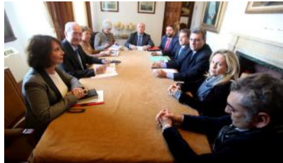
Los integrantes de Comercio&Málaga, en la reunión de hace unos días con el alcalde de Málaga.